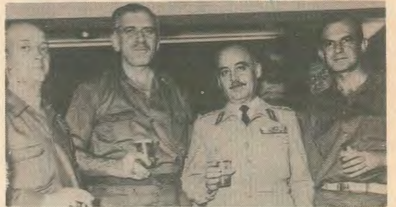
Οι κίνδυνοι για μια νέα 21η Απριλίου δεν έχουν εξαλειφθεί.

Υ.Γ. Εκπρόσωπος της Αμερικανικής Κυβέρνησης δήλωσε πως οι ΗΠΑ είναι εναντίον αντικυβερνητικού κινήματος στην Ελλάδα. Ξέχασε να προσθέσει «για την ώρα».